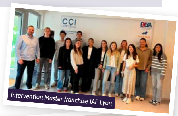
Intervention Master franchise IAE Lyon

« Encore un grand merci à notre formateur qui nous a captivés dans la bonne humeur et l'efficacité. »