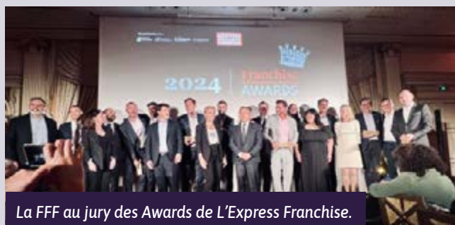
La FFF au jury des Awards de L'Express Franchise.