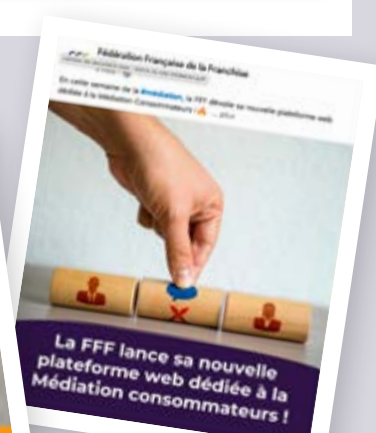
Mise en avant de la médiation et de l'arbitrage sur les réseaux sociaux