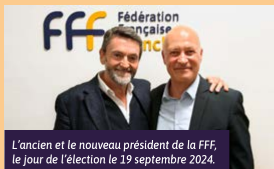
L'ancien et le nouveau président de la FFF, le jour de l'élection le 19 septembre 2024.