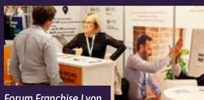
Forum Franchise Lyon