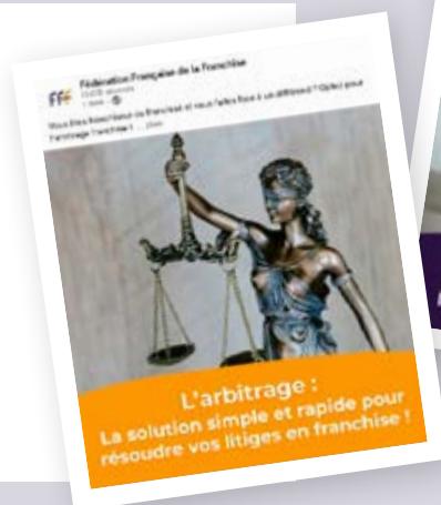
L'arbitrage : La solution simple et rapide pour résoudre vos litiges en franchise !