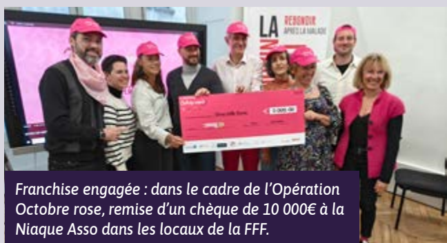
Franchise engagée : dans le cadre de l'Opération Octobre rose, remise d'un chèque de 10 000€ à la Niaque Asso dans les locaux de la FFF.