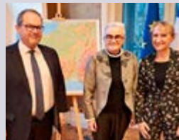
Rendez-vous avec Françoise Gatel, ministre déléguée chargée de la Ruralité, du Commerce et de l'Artisanat.