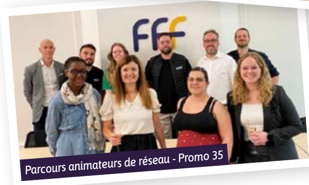
Parcours animateurs de réseau - Promo 35