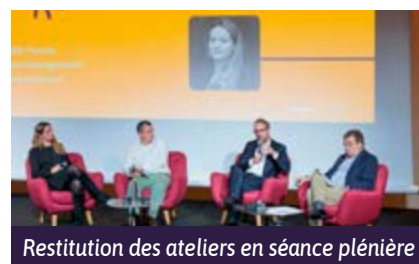
Restitution des ateliers en séance plénière