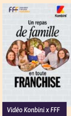
Vidéo Konbini x FFF