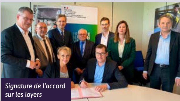
Signature de l'accord sur les loyers

La FFF a participé à la signature de l'accord visant la généralisation de la mensualisation des loyers et l'accélération du recouvrement des loyers.