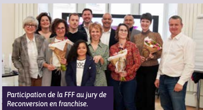
Participation de la FFF au jury de Reconversion en franchise.