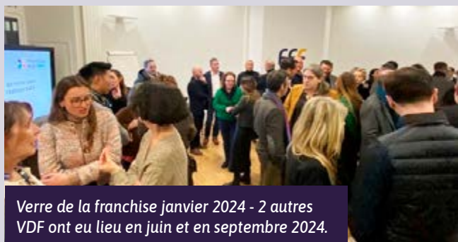
Verre de la franchise janvier 2024 - 2 autres VDF ont eu lieu en juin et en septembre 2024.