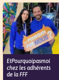
EtPourquoiPasmoi chez les adhérents de la FFF