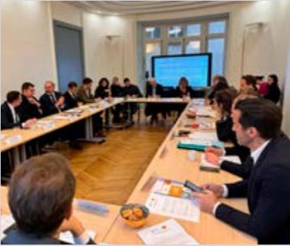
Table ronde FFF et Mastercard

La Fédération Française de la Franchise a organisé, en février 2024, un événement conjointement avec Mastercard, sur la thématique de la revitalisation des centres-villes. L'ambition a été de faciliter les échanges croisés entre maires et pouvoirs publics, commerçants, franchisés et autres professionnels pour identifier les bonnes pratiques au bénéfice des centres-villes.