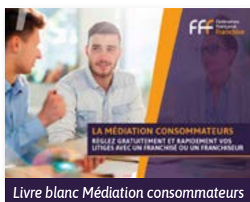
Livre blanc Médiation consommateurs

La FFF a également participé à une journée de séminaire le 19 décembre 2024 avec la CECMC, afin de partager des expériences avec d'autres médiateurs de la consommation. Enfin, la FFF suit les évolutions des textes au niveau européen, notamment grâce au groupe de travail mis en place par le MEDEF sur le sujet.