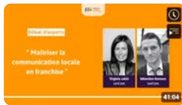
Webinaires Focus Franchise