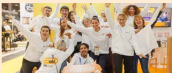
Toute l'équipe aux couleurs de l'opération EtPourquoi-pasmoi sur le salon Franchise Expo Paris

Pour promouvoir l'opération « Et pourquoi pas moi » lancée en 2023, la FFF a mis en place une série d'opérations : auprès de ses adhérents, sur le salon Franchise Expo Paris, et au travers d'une campagne publicitaire impactante au mois de juin 2024.