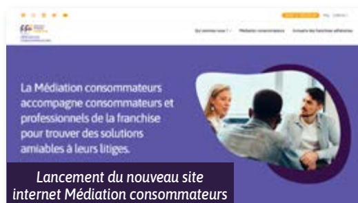
Lancement du nouveau site internet Médiation consommateurs