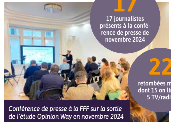
Conférence de presse à la FFF sur la sortie de l'étude Opinion Way en novembre 2024

retombées média dont 15 on line et 5 TV/radio