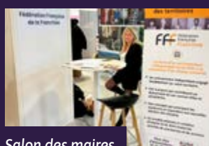
Salon des maires